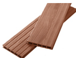
Unodeck Mogano тик