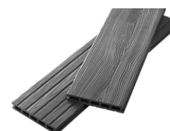
Unodeck Mogano графит