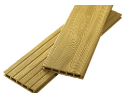
Unodeck Mogano орех