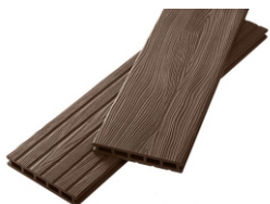
Unodeck Mogano венге