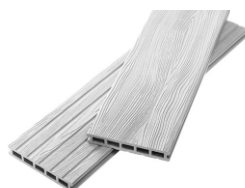
Unodeck Mogano слоновая кость