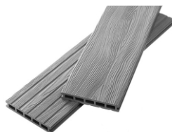
Unodeck Mogano серый