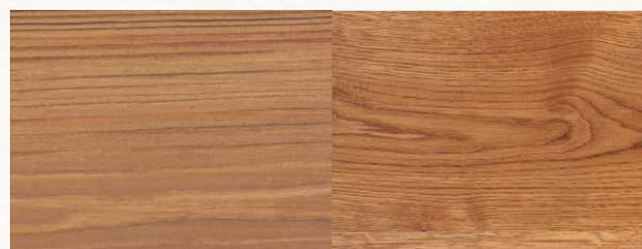
CEDER — Кедр