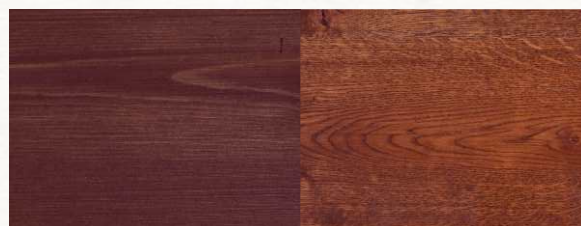
SWEDISH RED — Шведский красный