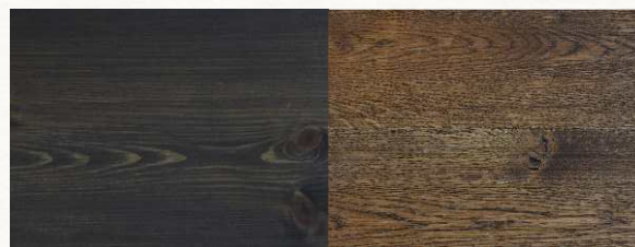
BLACK — Эбеновый