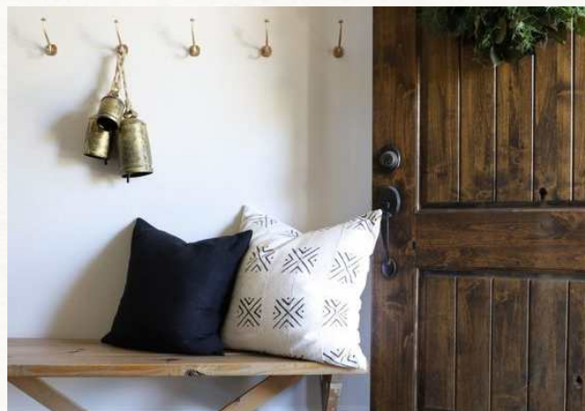
двери и окна