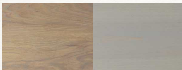
WARM GREY — Теплый серый