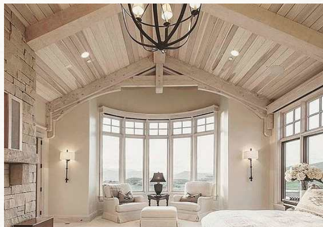
стены, пол и потолки