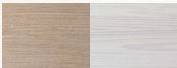
WARM WHITE — Теплый белый