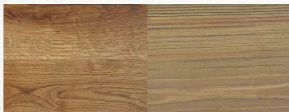
MID GREY — Серый